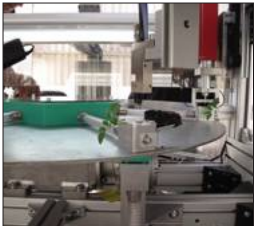
[ Vista dell'interno della macchina dal retro.