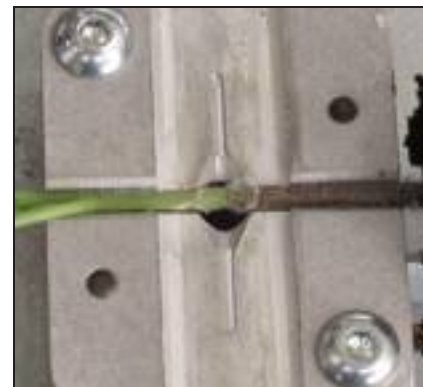
[ Piantina innestata ancora sulla piastra di allineamento.

Gli apparati di taglio sono forniti di un sistema di disinfezione automatico, programmabile via software, secondo le esigenze del vivaista. L'intero ciclo di produzione della pianta si compie in meno di 4 secondi, per cui la capacità produttiva di ogni singola macchina si assesta intorno alle 900 piante all'ora. La scelta di realizzare una macchina di dimensioni contenute e di facile utilizzo (tutte le funzioni sono regolate via software) è stata operata in considerazione delle esigenze dei vivaisti. Si è preferito, infatti, disporre di una macchina che richiedesse sempre l'intervento umano, anche se ridotto, ma che, a fronte di questo, consentisse di