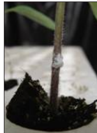
[ Innesto con adesivo.

Henkel ha, infatti, progettato e realizzato un nuovo dispenser integrato che consente di applicare con estrema precisione l'adesivo e di regolarne la quantità in base alla tipologia di pianta. Inoltre, è stato messo a punto il formulato chimico della colla per un corretto uso in campo vegetale e il packaging della stessa per consentirne una pratica gestione da parte del vivaista, il quale si trova a operare con un criterio del tutto simile a quello che viene utilizzato nell'impiego delle cartucce per stampanti per computer.