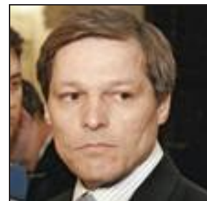
[ Dacian Cioloș , commissario all'Agricoltura e allo sviluppo rurale

L'Unione europea ha bisogno di una riforma della politica agricola comune, per rispondere alle sfide della sicurezza alimentare, la crescita e l'occupazione nelle zone rurali. L'agricoltura europea deve affrontare le richieste del mercato e le aspettative della società in materia di beni pubblici, l'ambiente e il cambiamento climatico. Per questo, voglio lanciare un ampio dibattito con gli Stati membri e tutte le parti interessate in tutta l'UE , ha dichiarato il commissario Cioloș .