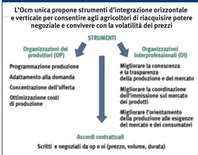
[ FIG. 2 - STRUMENTI PER LE FILIERE

zucchero scadranno, in base alla legislazione vigente, il 30 settembre 2015. Per il periodo successivo alla fine delle quote, lo zucchero bianco potrà beneficiare degli aiuti all'ammasso privato; per questo rimangono in vigore le disposizioni che disciplinano gli accordi fra gli zuccherifici e i coltivatori.