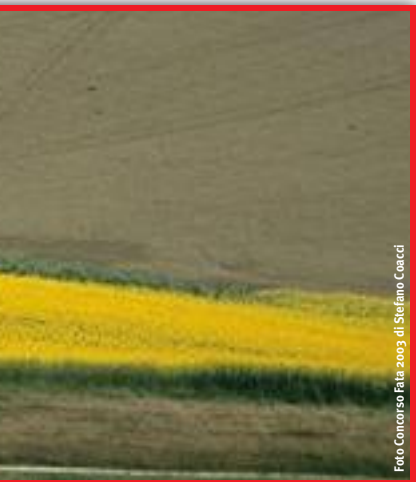
Concorso Fata 2003 di Stefano Cocchi